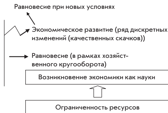
Рис. 1. Возникновение и суть экономической науки

Обобщить вышесказанное можно при помощи схемы, показанной на рис. 1.