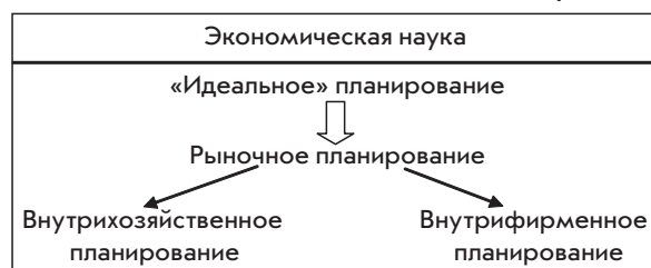
Рис. 3. Взаимосвязь основных видов планирования

Теория рынка как наиболее совершенной формы организации хозяйствования непредставима без описания огромного количества центростремительных сил, ведущих к состоянию равновесия. Поэтому идея планирования в ракурсе нашего рассмотрения является не чем иным, как идеей рыночного планирования. Схематично это показано на рис. 3.